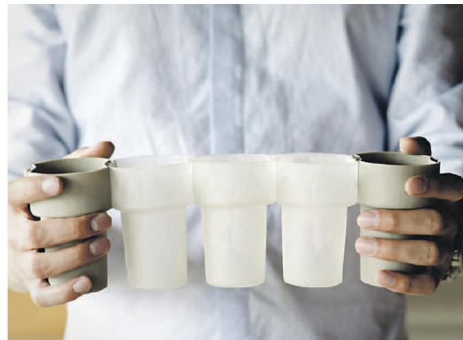
Een stel aaneengeklikte Clickup-bierglazen.